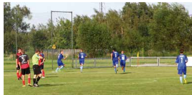
■ Radość piłkarzy Drogowca po strzeleniu zwycięskiego gola.

W ynikiem 1:0 dla Drogowca zakończył się sobotni mecz drugiej kolejki Campeon.pl Ligi Okręgowej.