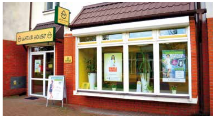
■ Centrum Dietetyczne Naturhouse ul. Warszawska 51/1