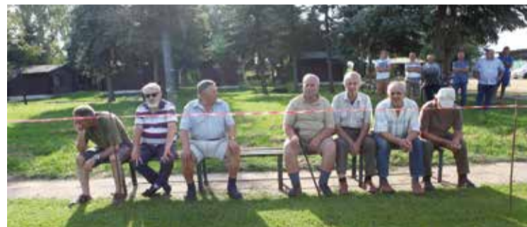
■ Najwierniejsi kibice klubu z Jedlińska.

Tym razem przeciwnikiem Drogowca była Zwolenianka Zwoleń, która po dwóch kolejkach zajmuje 14. miejsce w tabeli. Wyraźna przewaga Drogowca w pierwszej połowie nie przełożyła się jednak na wynik – przed przerwą piłka ani razu nie znalazła się w bramce, mimo iż było ku temu co najmniej kilka okazji.